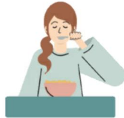
Minimal Eating Observation Form-2